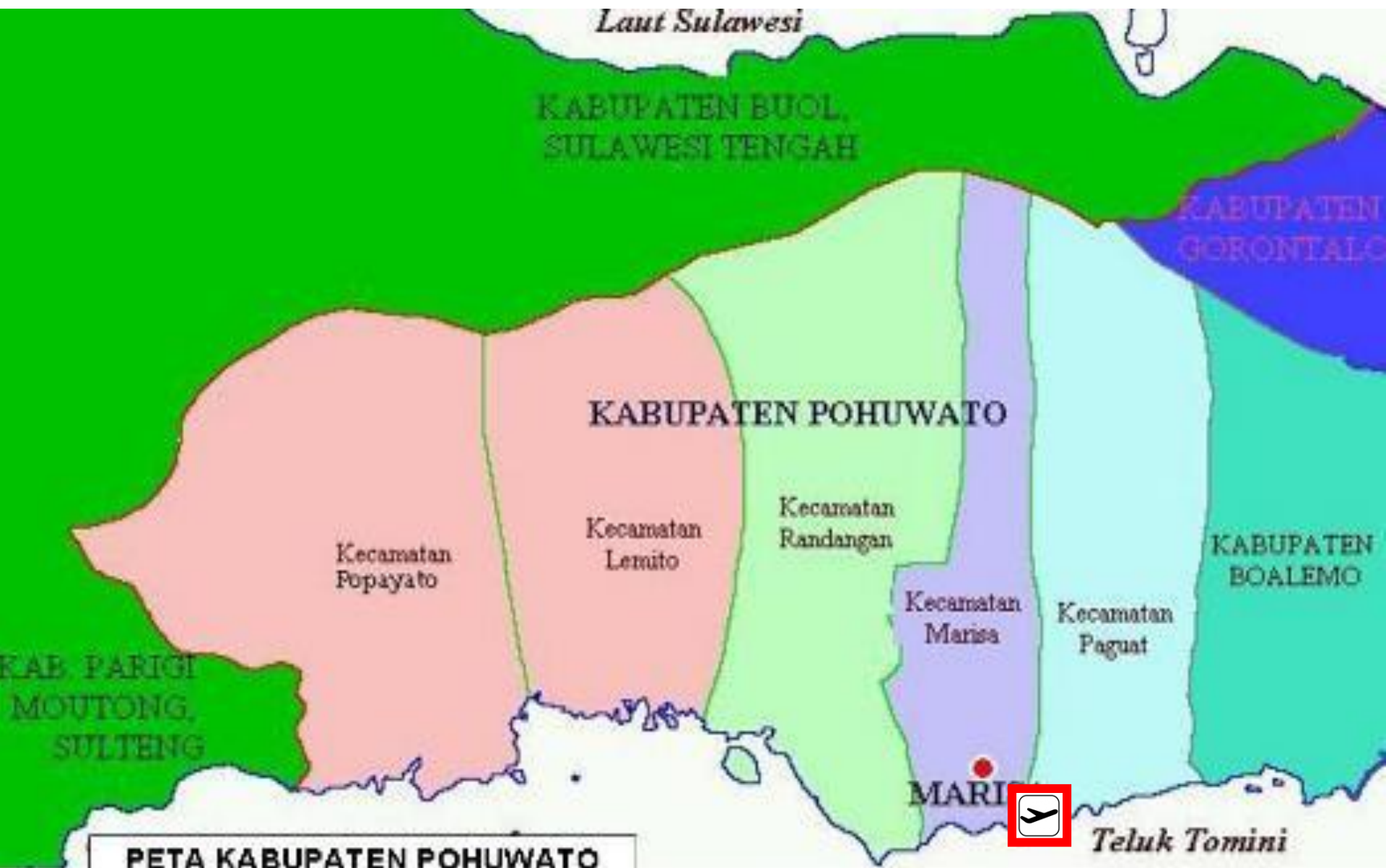
PETA KABUPATEN POHUWATO PROVINSI GORONTALO SULAWESI